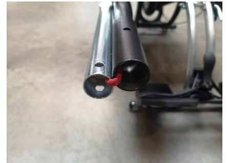
Gummizüge an den Armen