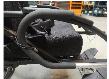
Griff rechter Vorderarm